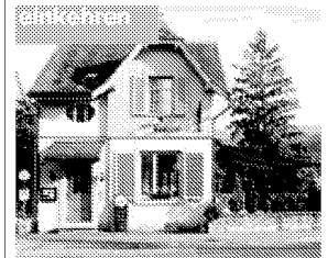
Restaurant Schlössli in Aesch.